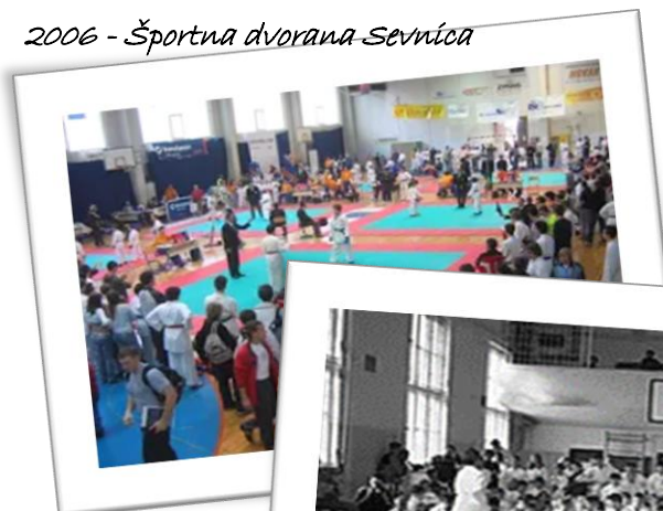
2006 - Športna dvorana Sevnica